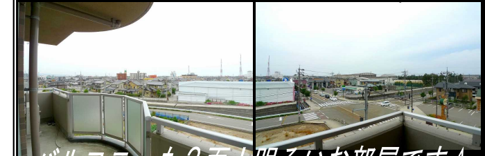
バルコニーも2面!明るいお部屋です☆