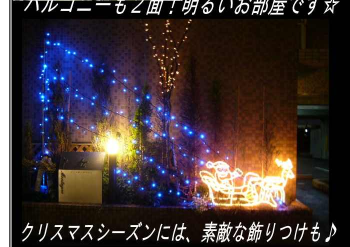
クリスマスシーズンには、素敵な飾りつけも♪