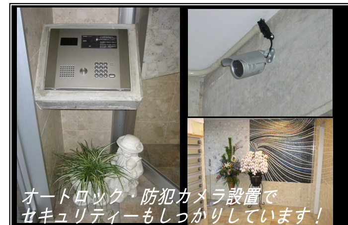
オートロック・防犯カメラ設置でセキュリティーもしっかりしています!

物件概要 物件名 四季の街 ドウ・モンターニュ虹 所在地 金沢市藤江北3丁目306 交通 北陸本線 金沢駅 バス 12分 市立工業高校前バス停 徒歩 3分 構造 RC(鉄筋コンクリート) 総戸数 22戸 面積 78.21㎡ 築年数 平成14年3月 入居日 即入居可 契約期間 2年 設備 オートロック・モニター付インターホン 追い焚き機能 etc. 学区 大徳小学校 大徳中学校