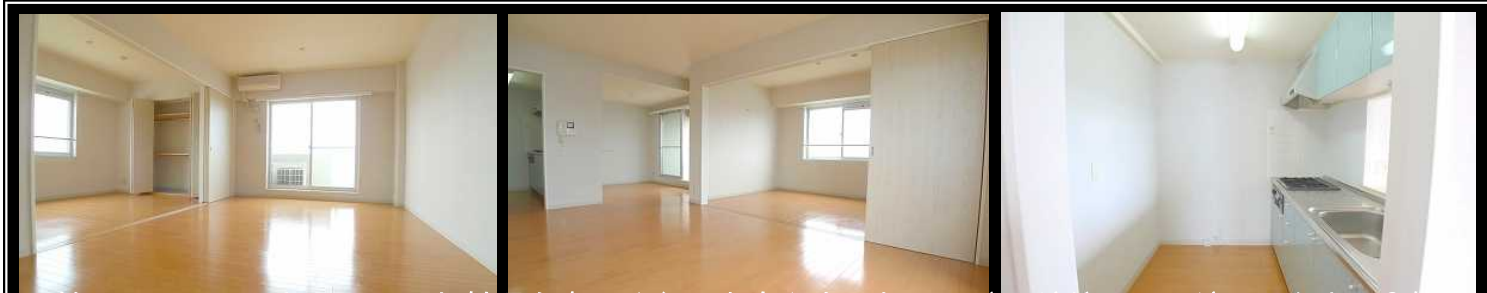
対面のシステムキッチンでお料理も楽しくなります♪ゆったりリビングダイニングは、14.2帖。バルコニーも2面で明るいお部屋ですよ!隣の洋室と繋げて使えばさらに広いリビングに☆☆☆