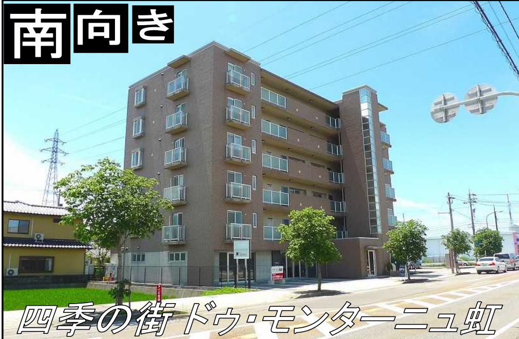
四季の街ドウ・モンターニュ虹

401号室【Aタイプ】 町費 300円 賃料 105,000円 共益費 7,000円 駐車料 8,000円 敷金 2.5ヶ月 礼金 2ヶ月