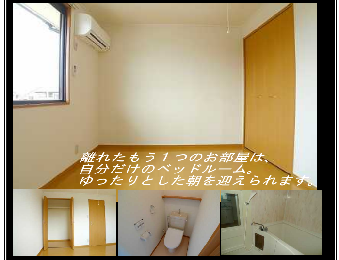
離れたもう1つのお部屋は、 自分だけのベッドルーム。 ゆったりとした朝を迎えられます。

対面キッチンでお料理も楽しい♪生活便・交通便も良い♪ 住宅街の松村で新生活を始めませんか?