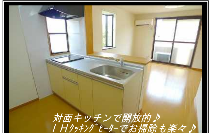
対面キッチンで開放的♪ IHクッキングヒーターでお掃除も楽々♪