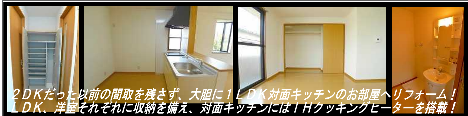
2DKだった以前の間取を残さず、大胆に1LDK対面キッチンのお部屋へリフォーム! LDK、洋室それぞれに収納を備え、対面キッチンにはIHクッキングヒーターを搭載!

賃料 52,000円 共益費 2,500円 駐車料 3,000円 敷金2ヶ月 礼金1ヶ月