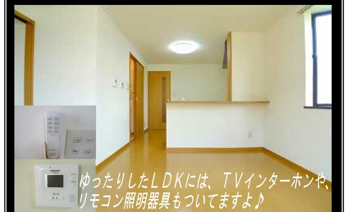
ゆったりしたLDKには、TVインターホンや、 リモコン照明器具もついてますよ♪